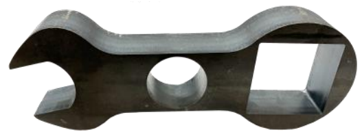
<板厚40mm切断サンプル>